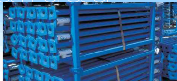
Almacenamiento de los puntales en paletas.

➔ NOPIN fabrica, comercializa y alquila material de construcción, puntales telescópicos personalizados, encofrados para muros rectos y circulares, encofrados de pilares, encofrados para losas planas, reticulares y de casetón recuperable, tableros de encofrar, cimbras, escaleras y vallas, así como todo tipo de andamios, ya sean tradicionales, o norma europea de fachada y multidireccional.